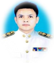
จำเอนนิตกร สิ้นเธาร์ นักทรัพยากรบุคคล