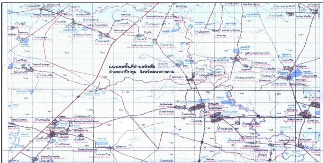
ภาพที่ 1 แสดงแผนที่ที่ตั้งและอาณาเขตตำบลหัวเรือ