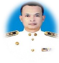
นักวิชาการคอมพิวเตอร์