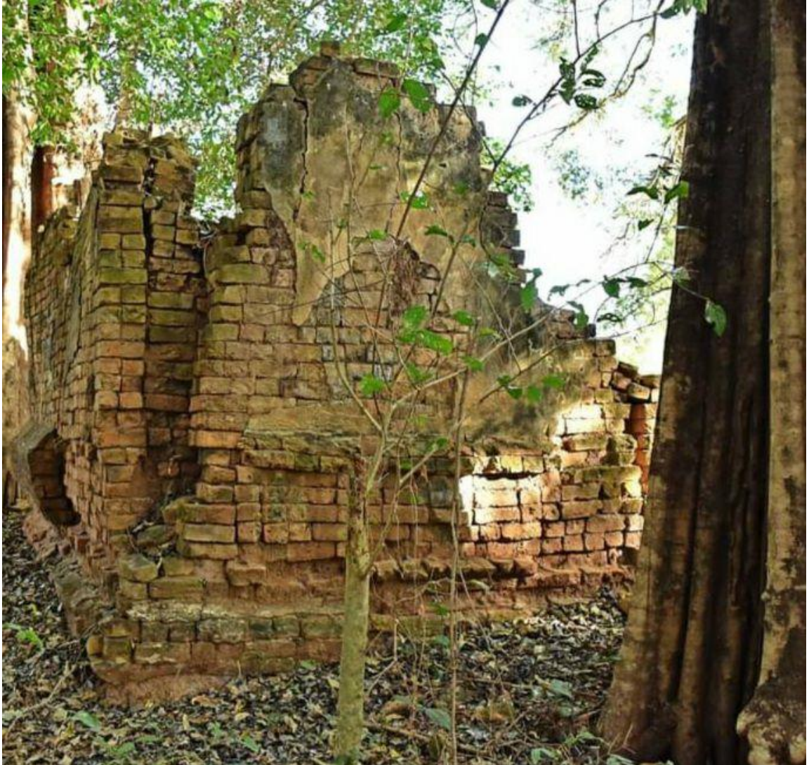
ภาพถ่ายสถานที่ตั้ง หมู่บ้านต้นกำเนิดตำบลหัวเรือในอดีต คือโนนแดงแซง